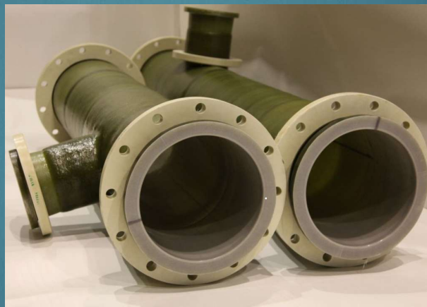
Pieza especial PVDF/FRP