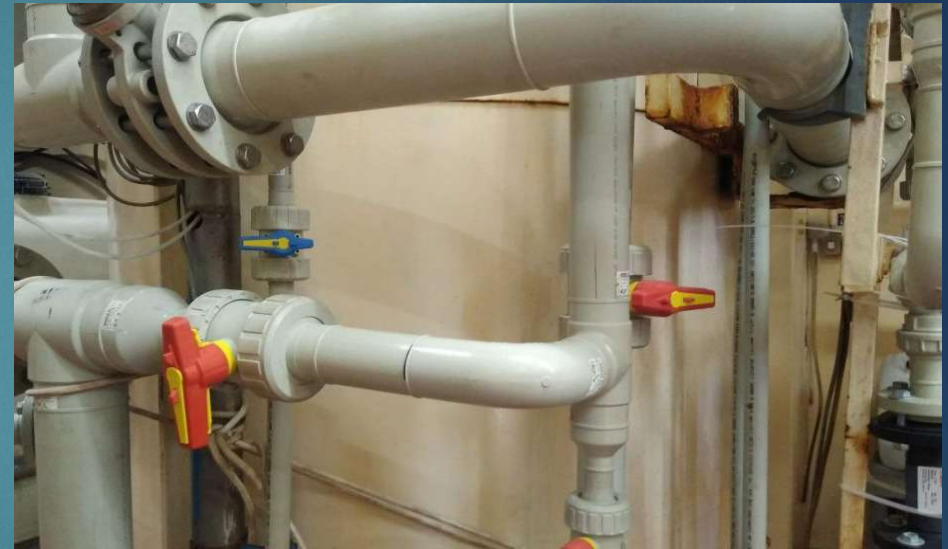
Spools tipos en PP